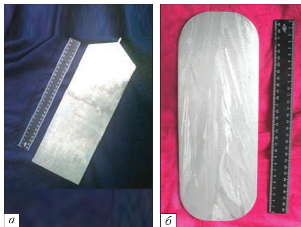
Рис. 1. Пластина оптичного германію (а) та виготовлене з неї вхідне вікно (б) для інфрачервоної техніки

власне виробництво новітню технологію виготовлення об'ємних кристалів оптичного германію, легованого натрієм. Ця оригінальна самоконтрольована технологія вирощування кристалів цього матеріалу має істотні технічні та економічні переваги перед найкращими світовими аналогами і дозволяє одержувати оптичний германій зі значно кращими оптичними параметрами, зокрема з низькою величиною розсіювання ІЧ-випромінювання, високим ступенем однорідності оптичних параметрів по об'єму кристалів тощо.