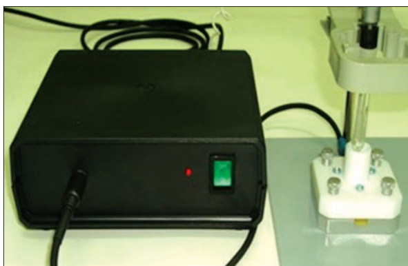
Рис. 6. Портативний вимірювальний перетворювач ІСПТ-3

зміни показника заломлення і товщини плівки. Як чутливі шари використовуються тонкі плівки трет-бутилкаліксаренів 3, 4, 5, 6-го та 8-го типів. Випробування експериментальних зразків течошукача аміаку було проведено на Северодонецькому об'єднанні «Азот».