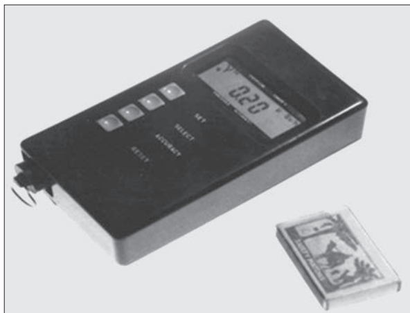
Рис. 9. Основний індикаторний блок багатofункціонального широкодiапазонного дозиметра-радіометра