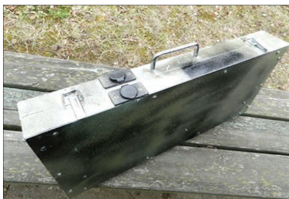
Рис. 8. Мобільна сонячна фотоелектрична станція

апазонний дозиметр-радіометр з набором зовнішніх детекторів призначений для експресного достовірного дозиметричного контролю \gamma - і \beta -іонізуючого випромінювання в широкому динамічному діапазоні в різних умовах експлуатації, зокрема й в екстремальних польових умовах. На відміну від відомих аналогів, прилад виконує принципово нову функцію — безперервний пошук та реєстрацію нестатистичних флуктуацій іонізуючого випромінювання, що дозволяє значно підвищити достовірність і швидкість вимірювання джерел малої інтенсивності.