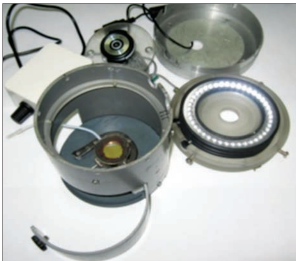
Рис. 5. Багатоелементний колориметричний аналізатор з круговим світлодіодним джерелом світла