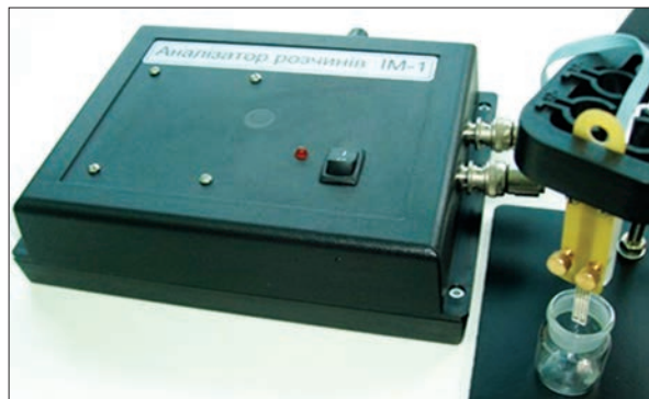
Рис. 7. Портативний вимірювач розчинів ІМ-1

Інтегрований прилад радіаційного контролю. Цей багатофункціональний широкоді-