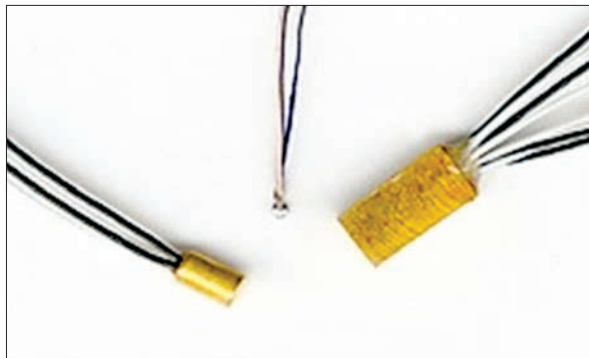
Рис. 2. Напівпровідникові мікросенсори для статичного і динамічного вимірювання температури в екстремальних умовах

Оптоелектронний газоаналізатор. Розроблений прилад призначений для детектування і аналізу газових сумішей у навколишньому середовищі, на промислових об'єктах, у про-