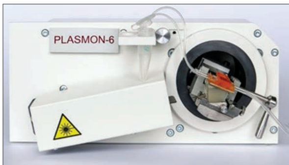
Рис. 4. Спектрометр загального призначення «Плазмон-6», базова модель

бах повітря та в медицині (рис. 5). Принцип його дії заснований на реєстрації зміни кольору тонкої інтерференційно забарвленої плівки (зазвичай органічної) на відбивній підкладці. Забарвлення змінюється при взаємодії з молекулами зовнішнього середовища внаслідок