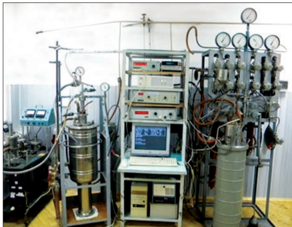
Рис. 10. Метрологічна установка для високоточного градування та повірки сенсорів температури з рекордною точністю градування

(м. Вишневе, Київська обл.) при випробуваннях стаціонарних і мобільних рентгенівських медичних комплексів (рис. 9).